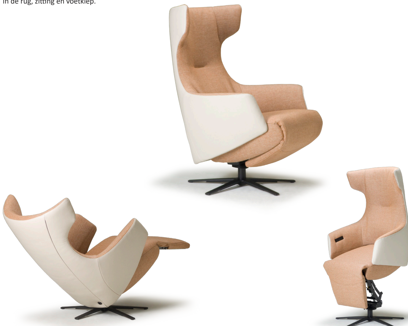
Afgebeeld: NV1005 met voet 87 (combi-stoffering)

De ruggen van alle Relax4u fauteuils zijn standaard voorzien van een handmatig verstelbare hoofdsteun. Als optie kan bij de fauteuil met motoren de hoofdsteun elektrisch verstelbaar bediend worden. Bij sommige modellen kan de rug worden uitgebreid met een opblaasbare lendensteun. Deze lendensteun is bij de handmatig verstelbare fauteuil alleen leverbaar met blaasbalg. Bij de elektrisch bedienbare fauteuil kan worden gekozen uit een handmatig - of elektrisch opblaasbare lendensteun en voor verwarming in de rug, zitting en voetklep.