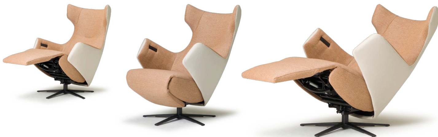
**metrages bij combi-stoffering

* Bij een fauteuil met zwarte voet wordt een zwarte tiptoetsbediening en oplaadplug ingebouwd. Bij voet 25 of voet 45 dient u de kleur van het tiptoetspaneel aan te geven.