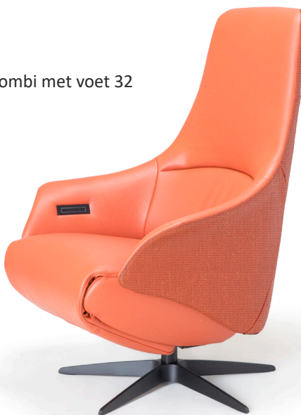
Afgebeeld: NV1027H combi met voet 32

De ruggen van alle Relax4u fauteuils zijn standaard voorzien van een handmatig verstelbare hoofdsteun. Als optie kan bij de fauteuil met motoren de hoofdsteun elektrisch verstelbaar bediend worden. Bij sommige modellen kan de rug worden uitgebreid met een opblaasbare lendensteun. Deze lendensteun is bij de handmatig verstelbare fauteuil alleen leverbaar met blaasbalg. Bij de elektrisch bedienbare fauteuil kan worden gekozen uit een handmatig - of elektrisch opblaasbare lendensteun en voor verwarming in de rug, zitting en voetklep.