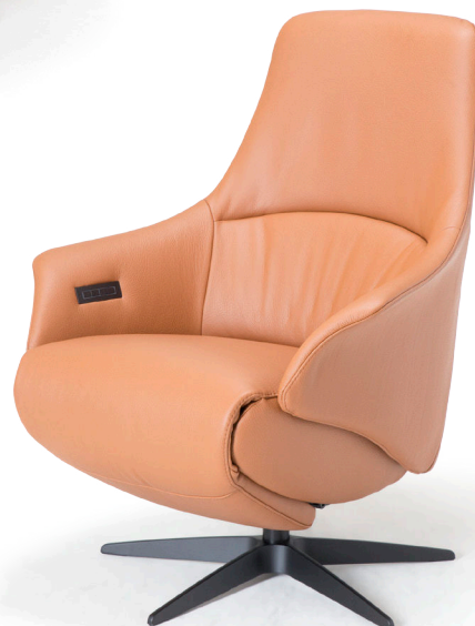
Afgebeeld: NV1027L met voet 32